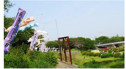
海蔵川こどもの日