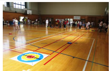
第12回ニュースポーツ大会