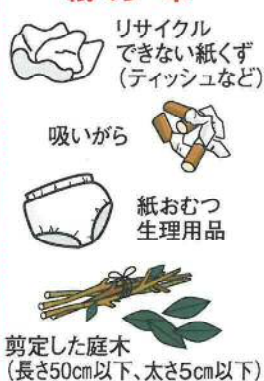
リサイクルできない紙くず (ティッシュなど) 吸い殻 紙おむつ 生理用品 剪定した庭木 (長さ50cm以下、太さ5cm以下)