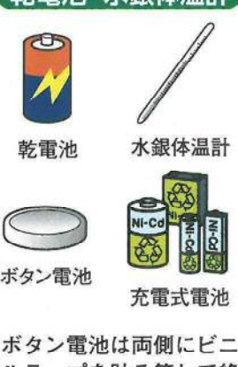
乾電池 水銀体温計 ボタン電池 充電式電池