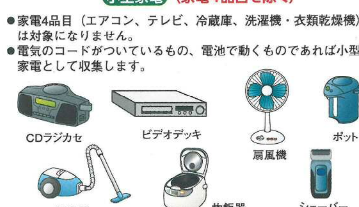
CDラジカセ ビデオデッキ 扇風機 ポット 掃除機 炊飯器 シェーバー