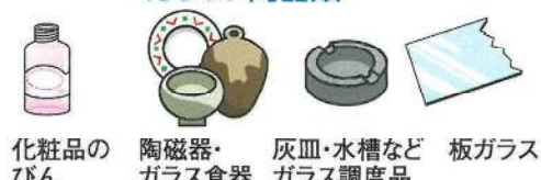
化粧品のびん 陶磁器・ガラス食器 灰皿・水槽など 板ガラス ガラス調度品