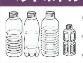
しょうゆ・お茶・酒 等