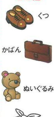
くつ かばん ぬいぐるみ