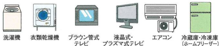
洗濯機 衣類乾燥機 ブラウン管式テレビ 液晶・プラズマ式テレビ エアコン 冷蔵庫・冷凍庫 (ホームフリーザー)