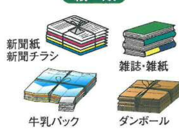
新聞紙 新聞チラシ 雑誌・雑紙 牛乳パック ダンボール