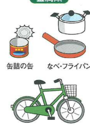
缶詰の缶 なべ・フライパン 自転車