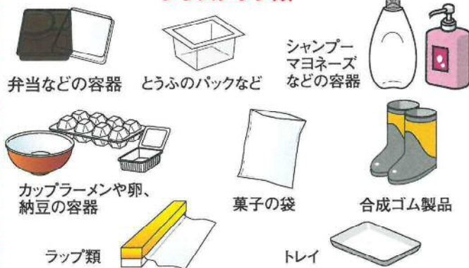
弁当などの容器 とうふのパックなど シャンプー・マヨネーズなどの容器 カップラーメンや卵、納豆の容器 菓子の袋 合成ゴム製品 ラップ類 トレイ