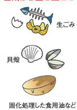
生ごみ 貝殻 固化処理した食用油など