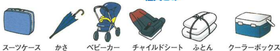
スーツケース かさ ベビーカー チャイルドシート ふとん クーラーボックス