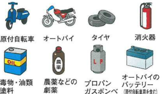
原付自転車 オートバイ タイヤ 消火器 毒物・油類塗料 農薬などの劇薬 プロパンガスボンベ オートバイのバッテリー (原付自転車用を含む)