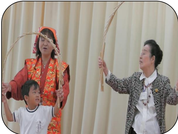
「南京玉すだれの曲芸に参加」