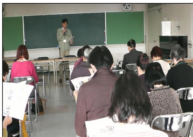
福祉講演会「地域包括ケアシステム」づくり 「大勢の方々ご参加ありがとうございました」