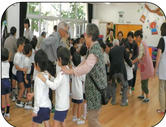
「みんなでじゃんけん列車」