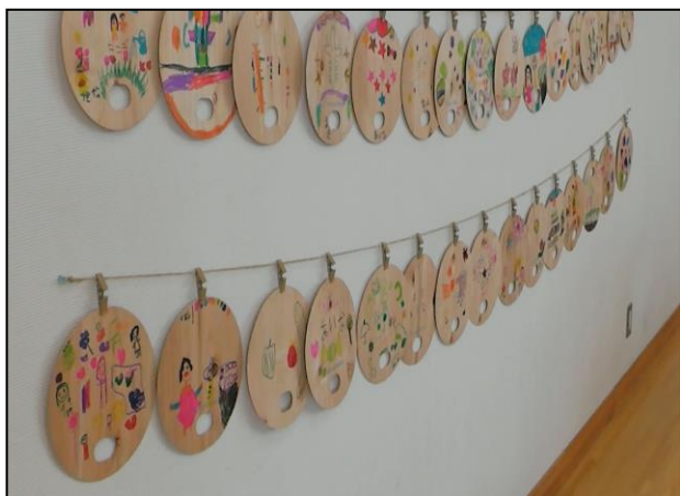
海蔵保育園交流会 「きれいな作品ができました」

※ 福祉体験教室と福祉講演会は素人撮影ですがビデオ撮りしました。 ご視聴していただく方は福祉部迄ご連絡下さい。