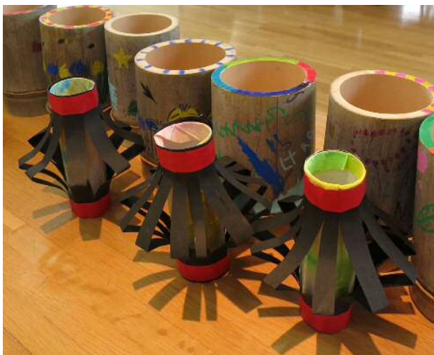
海蔵保育園交流会 「きれいな作品ができました」

※ 福祉体験教室と福祉講演会は素人撮影ですがビデオ撮りしました。 ご視聴していただく方は福祉部迄ご連絡下さい。