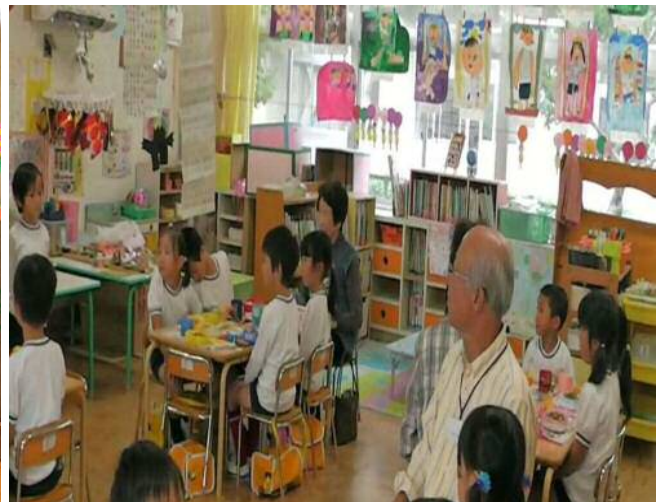
海蔵幼稚園交流会 「みなさん そろっていただきま〜す」