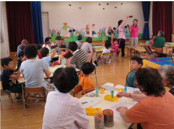
楽しく作品づくり！できたよ～◎

高齢者の方から「普段、小さな子と遊ぶ機会がないので、今日は楽しかった」との声も聞かれました。和やかな雰囲気の中、終始笑顔いっぱいの楽しい交流会でした。