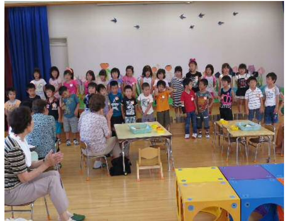
お歌の発表とても上手でしたね。