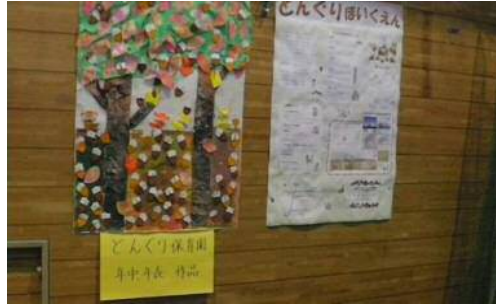
初めての参加「どんぐり保育園」