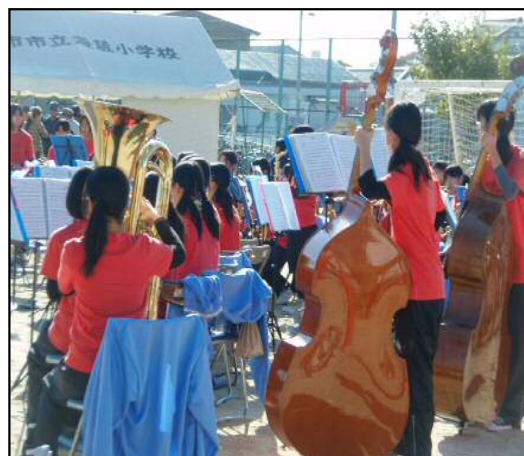
山手中吹奏楽部皆さんの演奏

この会場の福祉席に参加していただける方は、ご自身又はご家族に送迎して頂ける方のみです。次回も健康に気をつけてご参加下さい、お待ちしております。