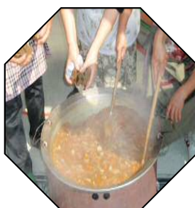
愛情いっぱい入ったカレーです