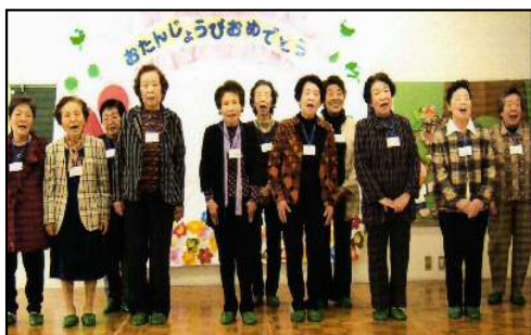
おばあちゃん達の合唱