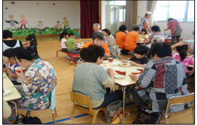
お爺ちゃん・お婆ちゃんと給食を戴いています