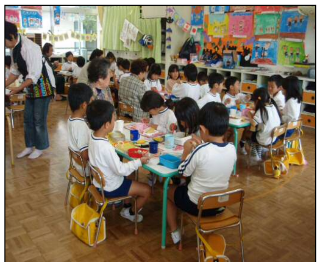
海蔵幼稚園交流会