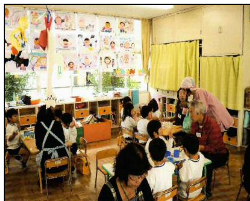
カレーでパーティー