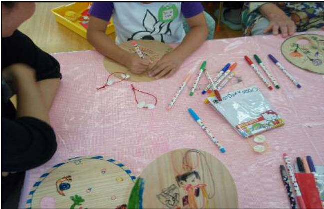
熱心に作品づくり！うまく描けたかな？

木製うちわを扇ぐと木の良い香りがしてきました。その後は園児の歌が披露され、又一緒に給食を食べたり楽しい時間を過ごせたと思います。最後に園児から手作りコースターのプレゼントがあり、参加していただいた方々もとても喜んでいただけました。そんな姿を見た園児たちは目を丸くしながら嬉しそうだった事が大変印象的でした。