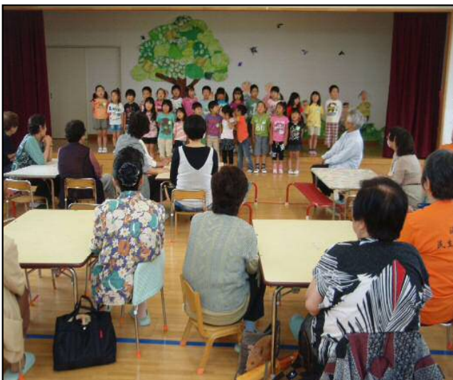
海蔵保育園交流会