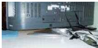
ベルトによるテレビの固定 (左：前面 右：背面)