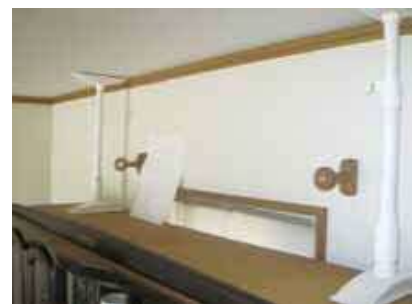
突っ張り棒による家具の固定

壁に固定金具を設置できる位置により、固定金具を選定。固定位置がない場合は、家具と天井の間で固定。