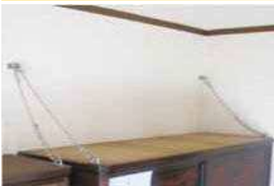
チェーンによる家具の固定