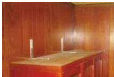
L型金具による家具の固定