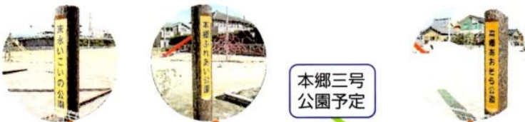
本郷三号公園予定