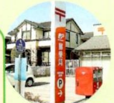
バスのりば 本郷郵便局