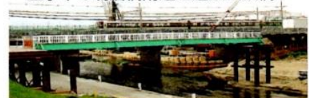
工事中の明治橋附近と近鉄の鉄橋