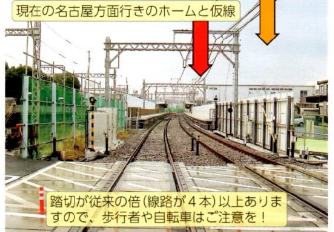
現在の名古屋方面行きホームと仮線