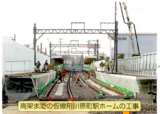
高架までの仮線用川原町駅ホームの工事

近鉄川原町駅周辺総合整備事業は、「平成19年に事業認可」をされてからは、具体的な工事にかかり、西町・西浦(三滝川堤防南)から海蔵川堤防までの約980mの区間が高架になる工事が進められています。完成は平成26年3月の予定ですが、現在の状況では、約1年位は工事が延びる(平成27年に完成)と言われています。