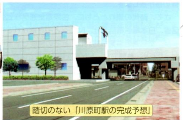
踏切のない「川原町駅の完成予想」

近鉄川原町駅周辺総合整備事業は、「平成19年に事業認可」をされてからは、具体的な工事にかかり、西町・西浦(三滝川堤防南)から海蔵川堤防までの約980mの区間が高架になる工事が進められています。完成は平成26年3月の予定ですが、現在の状況では、約1年位は工事が延びる(平成27年に完成)と言われています。