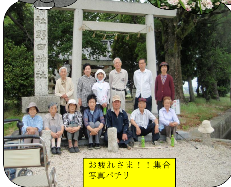
お疲れさま！！集合写真パチリ