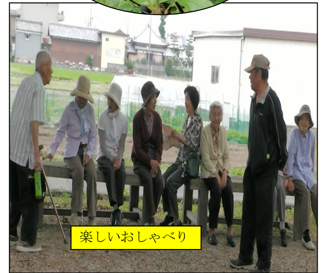
楽しいおしゃべり