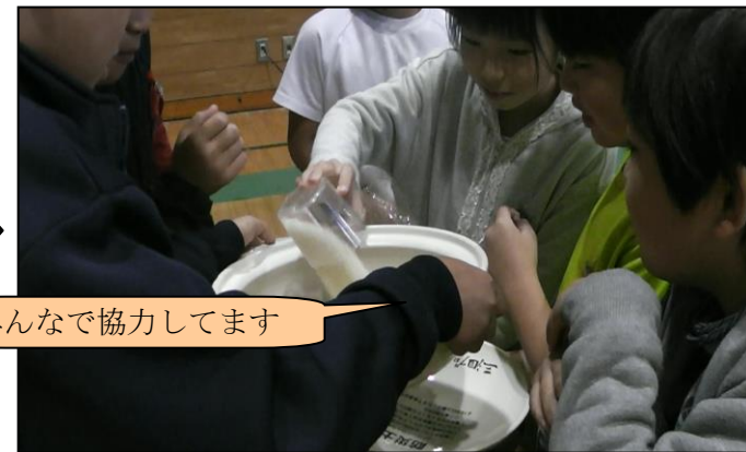
みんなで協力してます