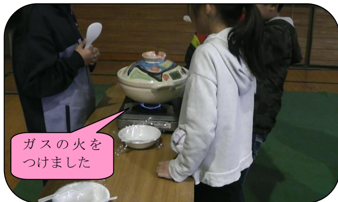
ガスの火をつけました