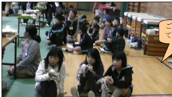
ご飯をいただいでいます。