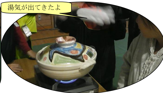
湯気が出てきたよ