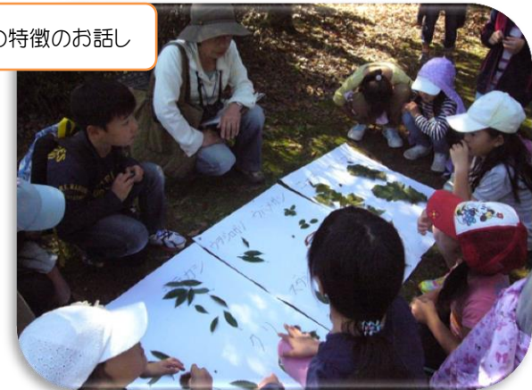
葉っぱの特徴のお話し