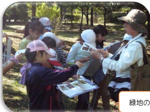
緑地の動植物を観察