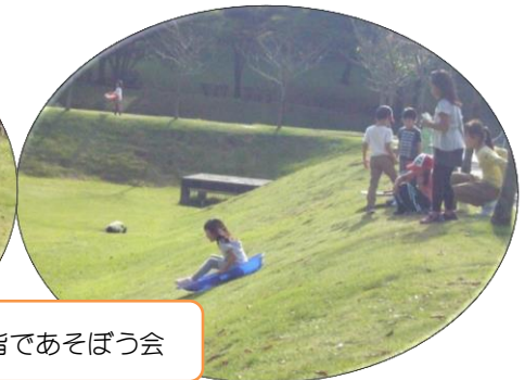
午後は皆であそぼう会