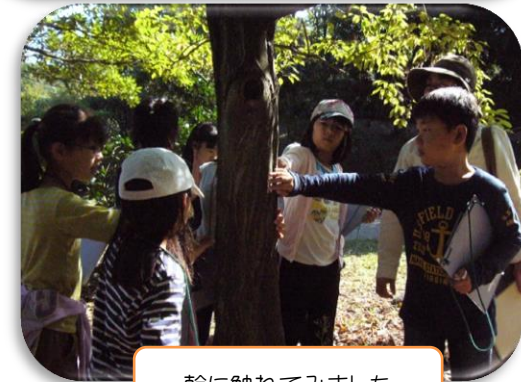
幹に触れてみました