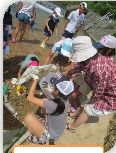
ごみ集めもしました。