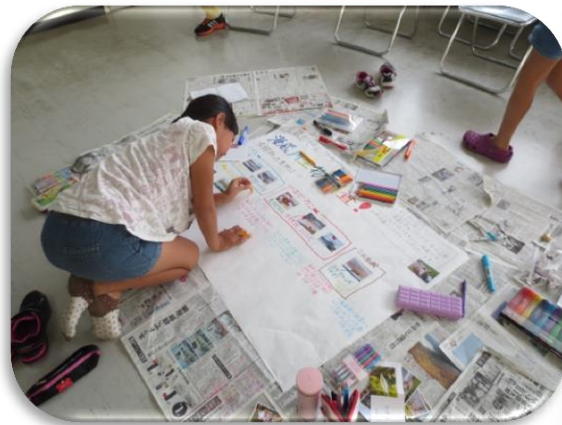
壁新聞を作っています。