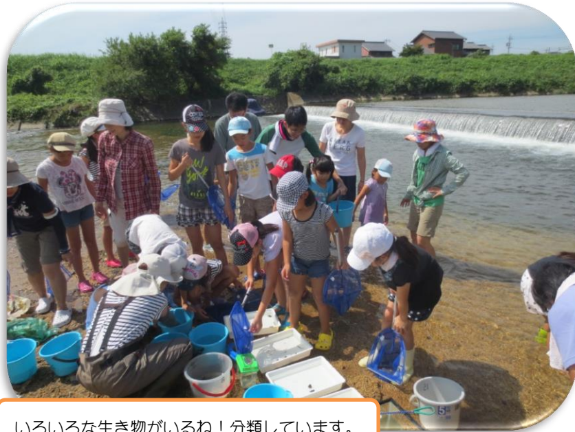
いろいろな生き物があるね！分類しています。