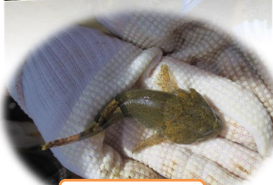
卵を持ったアユカケ