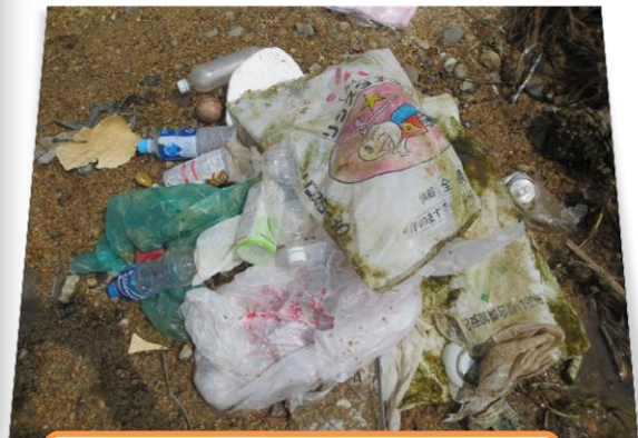
たくさんのごみ 生き物が可哀そう！