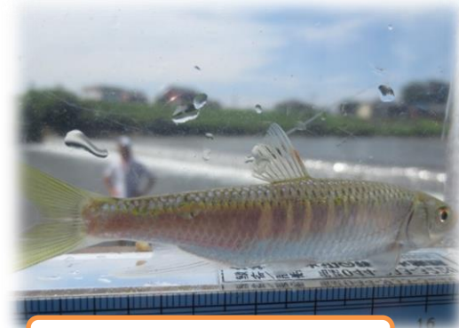
オイカワ 投げ網で採りました。