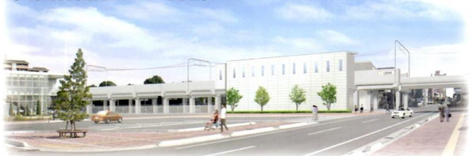
【川原町駅周辺完成イメージ予想図】

そうですね。 高架にすることで、5カ所の 踏切がなくなります。 交差する道路も整備されま すので、踏切による渋滞も 解消されますね。